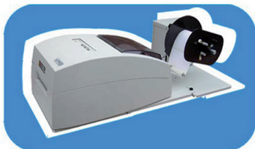
modèle SUAP Dérouleur avec mandrin réglable