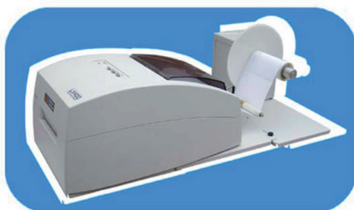
modèle SU1P Dérouleur avec mandrin de 1"